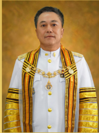
สาร์นายกสภา