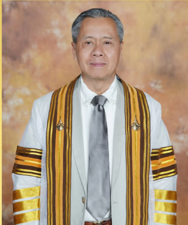
คำประกาศเกียรติคุณบัณฑิตกิตติมศักดิ์ มหาวิทยาลัยเทคโนโลยีราชมงคลล้านนา ปริญญา บริหารธุรกิจดุษฎีบัณฑิตกิตติมศักดิ์ (บริหารธุรกิจ)