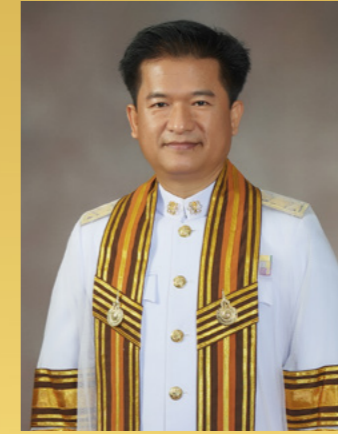
สาร์อธิการบดี

นายกสภามหาวิทยาลัยเทคโนโลยีราชมงคลล้านนา