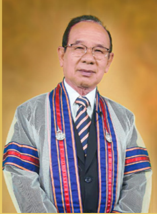
สภานายกสมาคมศิษย์เก่า มหาวิทยาลัยเทคโนโลยีราชมงคลล้านนา

ผู้ที่ได้ชื่อว่าเป็นบัณฑิต คือ ผู้มีปัญหา มีความรู้ และเป็นนักปราชญ์ ทุกคนได้ศึกษาเล่าเรียนมาด้วยความพากเพียร วิริยะ อุตสาหะ มาถึงวันนี้ท่านคือ บัณฑิต ใบเบิกทางที่สำคัญในการก้าวเดินสู่สังคมของการทำงานคือ ปริญญาบัตร ซึ่งการทำงานต้องใช้ความรู้ ความสามารถ ความอดทน ความซื่อสัตย์ ความมีคุณธรรม ทั้งต่อผู้อื่น และต่อตนเองตลอดจนการมีสัมมาคารวะ มีความอ่อนน้อมถ่อมตน เป็นสิ่งที่บัณฑิตทั้งหลายพึงมี