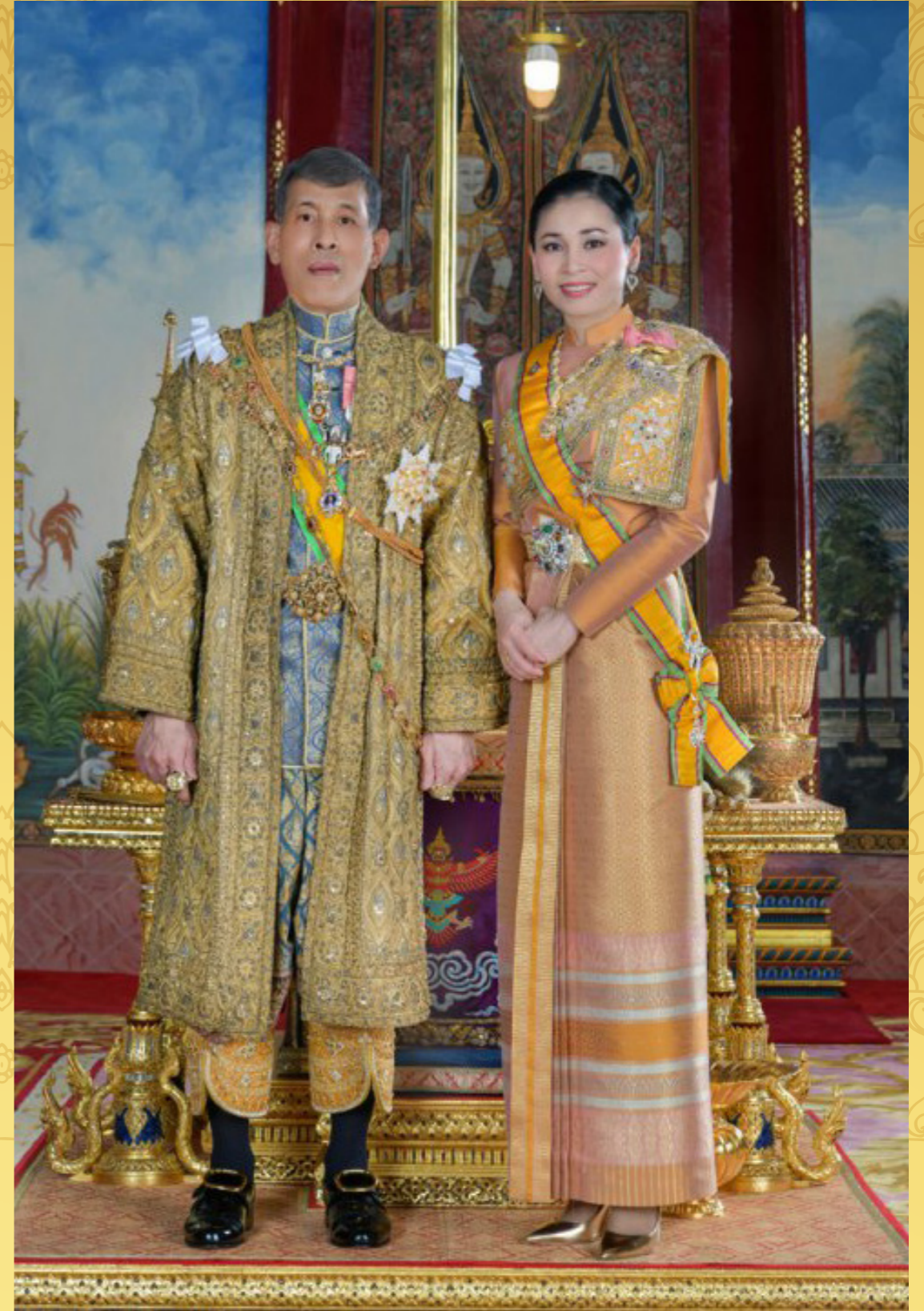
ทรงพระเจริญ